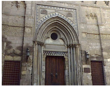
Görsel 1. Sultan el-Nâsir Camii'ne Akkâ'dan getirilmiş taç kapı, Kahire

Yine tam da bu ifadeler referans alınarak tersine bir örneklendirme yapılabileceğini, İslam kültüründe de Batı medeniyetine dair bir istisna olduğunu ekleyerek Haçlıların Akkâ'yı kaybettikten sonra burada bulunan St. John Kilisesi'nin portalının sökülüp Kahire'de bulunan Sultan El-Nâsir Medresesi'nin taç kapısına ( Görsel 1 ) dönüştürüldüğünü de eklemektedir (Draper, 2005, s. 19). Bu örnek, alt metnine bakıldığında sadece mimari bir formun farklı bir mimari yapıya eklenmesi olarak açıklanamamaktadır. Hristiyanların dini yapısında bulunan bir mimari unsurun artık Müslümanların dini bir yapısında kullanılması ile bir nevi İslami bir fetih sembolü olarak da ifade edilebilmektedir (Çolak Boncukçu, 2019).