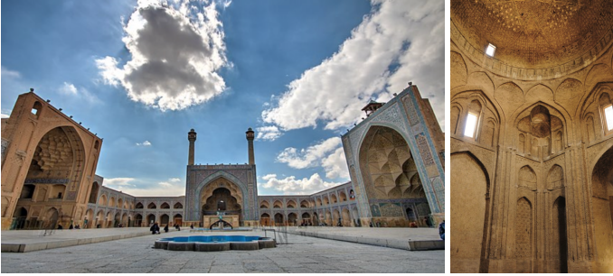
Görsel 5. Mescid-i Cuma, İsfahan (wikimedia.org, ___b) ve Kümbet-i Hâkî, İsfahan (ikolsoftware.com, ___)