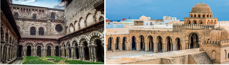
Görsel 6. Le Puy Katedrali, Auvergne (wikimedia.org, ____c) ve Kayrevan Camii, Kayrevan (merzifoncamileri.com, ____)