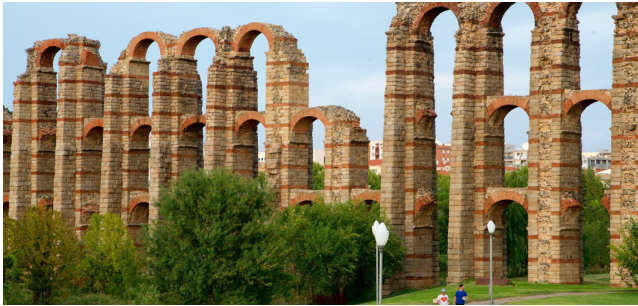
Görsel 3. Mucizevi su kemeri, Merida