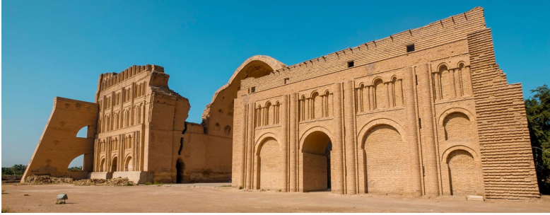
Görsel 4. Tâk-ı Kistrâ, Madain (cloudfront.net, ___)

Yine Stierlin'e göre günümüzde Irak sınırları içerisinde bulunan ve 3. yüzyıla tarihlenen bir Sasani yapısı olan Tâk-ı Kistrâ (Görsel 4) tuğladan yapılmış anıtsal kemeri ve muazzam eyvanı ile de Arapların gözünde İslam öncesi mimari modeli oluşturuyordu (Stierlin, 2015, s. 36).