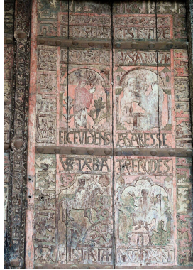
Görsel 7. Le Puy Katedrali kapısı (wikimedia.org, ____d)

Le Puy Katedrali’ni önemli kılan bir diğer husus ise İslam mimarisi ile olan tek benzerliğinin strüktürel yapısı ile olmayışıdır. Le Puy Katedrali’nin kapısında kufi yazısına benzetilen süsleme unsurları ( Görsel 7 ) bulunmaktadır (Grabar, 1975).