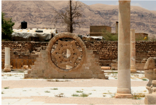
Görsel 9. Hirbetü'l-Mefcer'in dış duvarında bulunan altıgen rozet pencere, Eliha

Mimar ve kuramcı olan Adolf Loos (2020) genel anlamı ile mimaride süslemeyi kesin bir dille eleştirmekte ve bunun parayı heba etmek hatta mimari yapılarda süslemenin cinayet işlemek kadar ağır bir suç olduğunu ifade etmekteyken; sanat eleştirmeni John Ruskin ise (1889) bu görüşün tam tersi bir bakış açısı ile süslemenin mimarinin asıl kaynağı olduğunu öne sürmektedir. Grabar (1975) Gotik tarzdaki örtü sistemlerinin de İslam mimarisi menşei olabileceğine dair Pope'un bu çalışmada da bahsi geçen 1930'lu yıllarda ortaya çıkan görüşüne atıfta bulunmakla birlikte bunun ispatının pek de mümkün olmadığını eklemektedir. Yine de gerek İslam mimarisinde gerekse Batı mimarisinde strüktürel olarak yükseklik ve aydınlatma sorunları ile karşı karşıya kalındığını ve her iki tarafında duvarlarda bulunan yükü azaltmanın yollarını aradığını da eklemiştir. Bu gibi benzerliklerde Grabar'ın şüphe ile yaklaştığı bir diğer unsur ise Batı mimarisinde özellikle Gotik üslupta karşımıza çıkan diğer adı rozet pencere olan gülpencere kullanımının, sekizinci yüzyıla tarihlenen bir Emevi Sarayı olan Hirbetü'l-Mefcer'de ortaya çıkmasıdır.